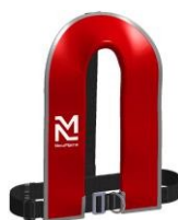
PL01 165 s postrojom HPP117 (pracka postroja z nehrdzavejúcej ocele )