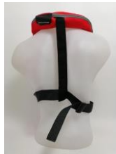
PILOT 165 ZIP